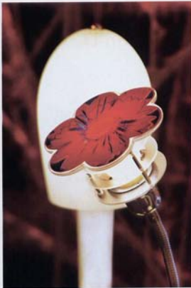
Lámpara de mesa con flor. Línea "Natura lesa". D+U Dosmasuno

"Design Connection ya ocupa un espacio en el calendario internacional de eventos dedicados al diseño. Y me animo a decir que en lugar de seguir tendencias internacionales, las estamos generando. Los productos innovadores y ecológicamente sustentables creados por nuestros indiscutiblemente talentosos diseñadores, se abren camino en Europa y en el resto del mundo. Cumplido entonces mi sueño inicial de insertar a Buenos Aires en el calendario mundial, hoy sumo la coordinación del proyecto ReMade in Argentina en el nivel regional; y como siempre hay que mirar más allá en el futuro próximo trabajaremos para concretar el primer Centro de Ecodiseño de América del Sur destinado a promover una nueva cultura del reciclado; un proyecto en común con el arquitecto Marco Capellini, mentor de ReMade in Italy.