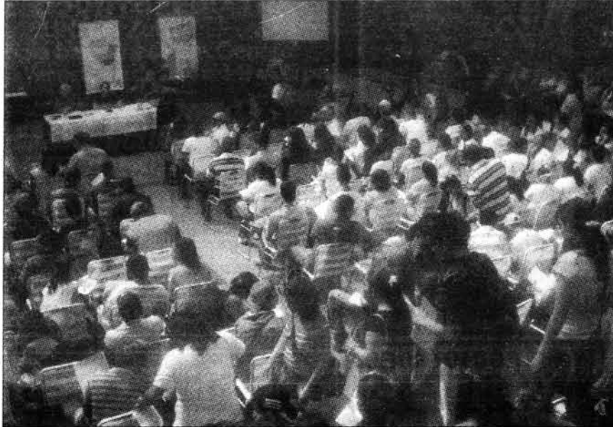
Asistieron más de 200 personas

Debido al mayor índice de los procesos industriales y el alto nivel de consumo de la sociedad, los cuales han estado afectando desde hace algunos años el equilibrio natural del planeta, hoy en día, algunas organizaciones han tenido el propósito de